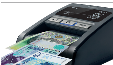
Vérifie 9 devises