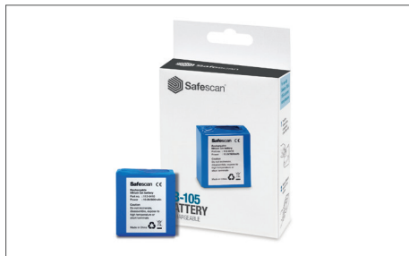
Safescan LB-105 Batterie rechargeable Art. no: 112-0410