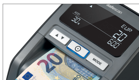
Affiche la quantité et les totaux