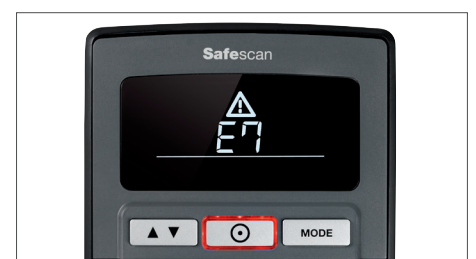
Alerte visuelle et sonore en cas de détection de billets suspects