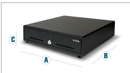
Dimensions : A: 35 cm - B: 40.5 cm - C: 10.5 cm