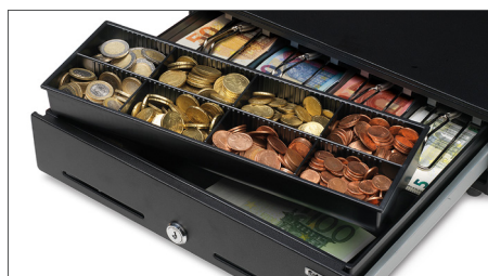
Bac amovible pour 8 pièces différentes