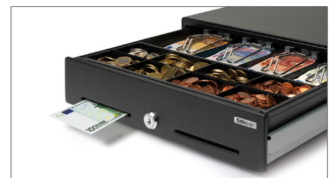
Fente d'écremage permettant de cacher les papiers de valeur et les grosses coupures