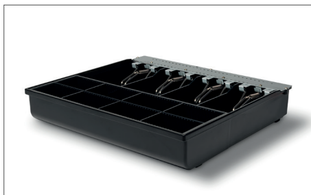
Safescan 3540T Tiroir-caisse Art. no: 132-0428